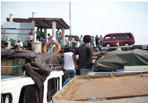
Gambar 1 : Fenomena Sistem Transportasi Andalan yang Menghubungkan Kawasan Pesisir dan Pulau-Pulau Kecil

Adapun isu spesifik yang ada di setiap pesisir dan pulau-pulau kecil muncul berkaitan dengan kondisi khusus yang terjadi dalam upaya pembangunan dan pengembangan pemanfaatan ruang yang ada dan pada saatnya diprediksikan akan terus mengalami perkembangan, sejalan dengan aktivitas investasi budidaya dan pariwisata pulau-pulau kecil yang bergiat di dalamnya.